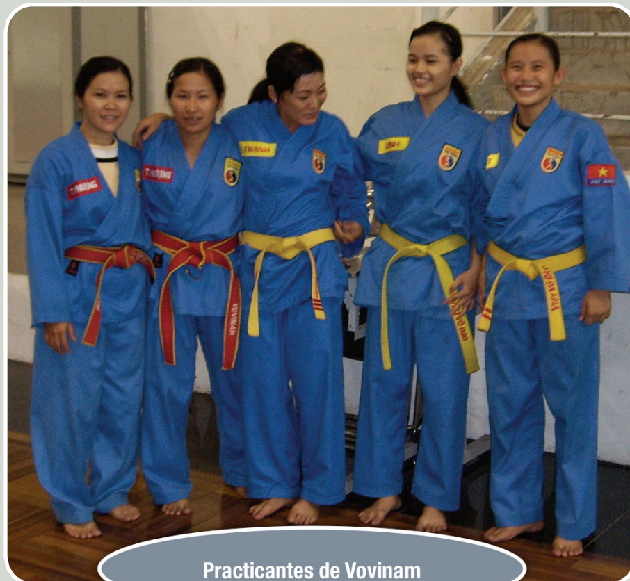
Practicantes de Vovinam

Los monitores que impartirán estos cursos tienen amplia experiencia en la enseñanza y buscan acercar el conocimiento específico de autoprotección de las mujeres, independientemente que hayan practicado o no con anterioridad artes marciales, iniciándose en las técnicas básicas a tal fin y que, casi con total seguridad, podemos asegurar que será un éxito y que desde esta revista haremos un seguimiento. Más información en: www.vovinam.es/canarias