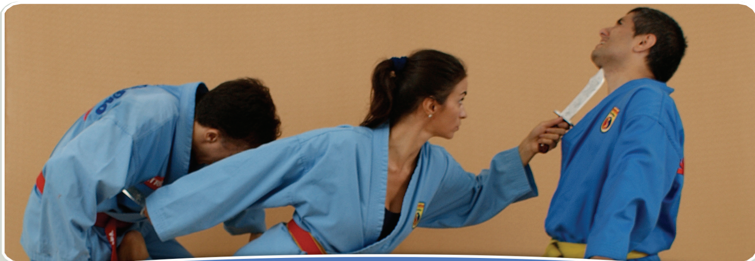
La Maestra Danka ante dos adversarios